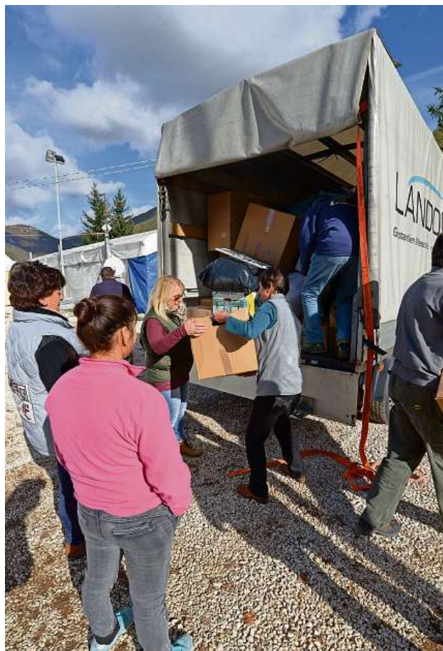
Die Tage danach: Feuerwehrleute sichern eine Kirche, Hilfsgüter gehen ins Zeltlager, Schäden im Bergdorf sind von fern nur zu erahnen.